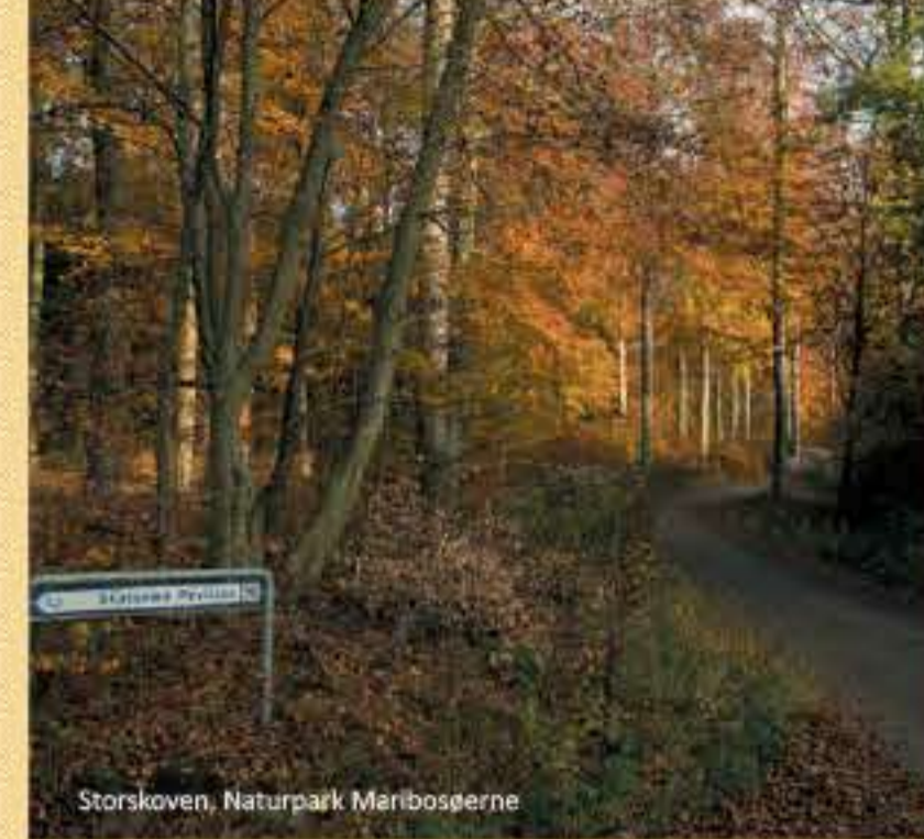
Storskoven, Naturpark Maribosøerne

NATURPARK MARIBO Naturpark Maribosøerne er bogstaveligt talt en del af byen. 50 km 2 smukke søer, et rigt dyreliv med bl.a. havørn og en billedskøn natur. Maribosøerne er et af Danmarks største ferskvandssystemer med i alt 1140 hektar vandspejl. Sønder sø er den største af søerne og Danmarks 8. største sø. Den består af tre bassiner og er med sine 13 regulere søer, 6 småholme og 3 hængesæk søer uden sammenligning Danmarks mest ørige sø. Røgsølle Sø er næststørst, derefter kommer Hejrede sø og Nørresø. Søerne ligger i et område med store lavninger, der er dannet under afsmeltningen af kæmpemæssige isblokke efterladt af gletschere under den sidste istid. I dag er det et storslået herregårdslandskab i gåafstand fra byen, og der venter dejlige naturoplevelser, hvad enten du kommer for at vandre, studere fuglelivet eller tage en sejltur med turbdænen Anemomen. Du kan også opleve Frilandsmuseet i Maribo, der er en lille perle omgivet af skov, og som gennem årtier har begejstret besøgende og givet oplevelser til krop og sjæl.